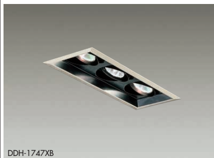
DDH-1747XB ユニバーサル 首振り角 左右 30/25° 近接限度 0.4m