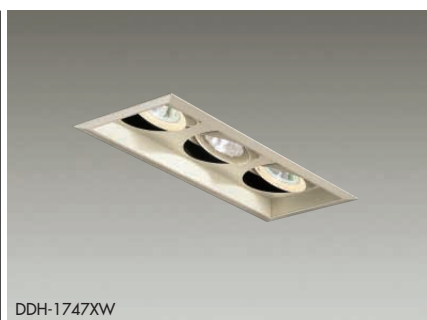
DDH-1747XW ユニバーサル 首振り角 左右 30/25° 近接限度 0.4m