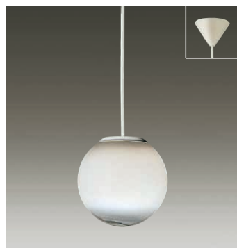
DPN-53891 ¥21,000 ランプ付

職人の高い技術によってつくられたグラデーションガラス。神秘的な光を放ちながら直下への光も得ることができます。