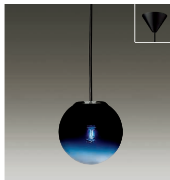
DPN-53892 ¥21,000 ランプ付

40W G9 × 1灯 HALOPIN® 本体 / 銅板 白塗装 カバー / ガラス 乳白 (一部透明) ● 0.7kg ● コード0.8m付 [ハンドメイド]