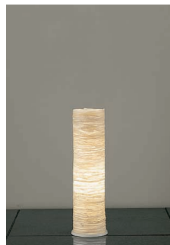
DST-52716 ¥24,000 ランプ付