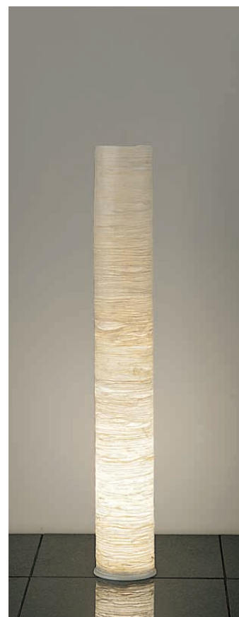
DST-52718 ¥36,000 ランプ付