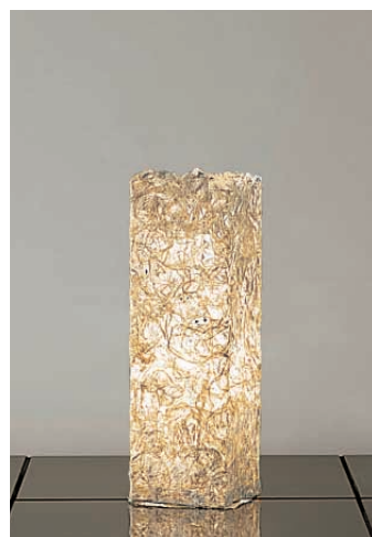
DST-53649 ¥29,800 ランプ付