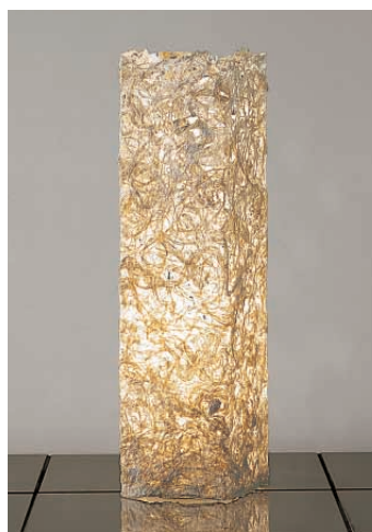
DST-53650 ¥42,000 ランプ付

楮(こうぞ)をランダムに漉き込むことで素材の持つ表情と映し出される光に自然の風合いが感じられます。